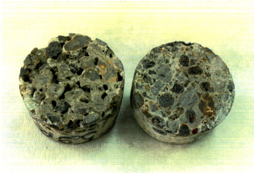
Bild 1: Borkern aus nicht injiziertem Leichtbeton (links im Bild), Bohrkern aus zementleiminjiziertem Leichtbeton (rechts im Bild)